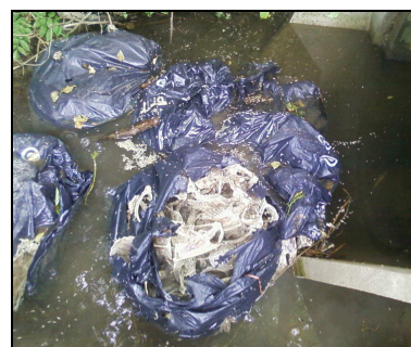
Carcasses de poulets