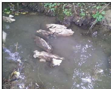
Ruisseau du Breyelgraben

En effet, les bords de routes, les chemins ruraux et forestiers sont jonchés de débris divers (pneus, vieux meubles, gravats, végétaux).